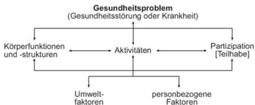
Abbildung 1: Das bio-psycho-soziale Modell der Komponenten der Gesundheit

Entsprechend der ICF sind unter dem Oberbegriff der Funktionsfähigkeit für die einzelnen Komponenten von Gesundheit die Begriffe Körperfunktionen und Körperstrukturen, Aktivitäten, Teilhabe und Kontextfaktoren eingeführt und definiert worden. Auf allen Ebenen finden die unterschiedlichen Wechselwirkungen zwischen Kontextfaktoren und Gesundheitsproblemen besondere Beachtung (s. Abbildung 1).